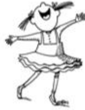
buscar la felicidad