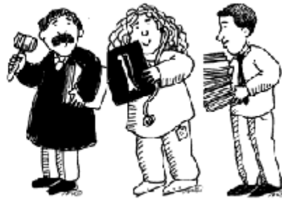
Corte de impuestos

“La gente desempeña un papel activo en el partido que los gustan más.”