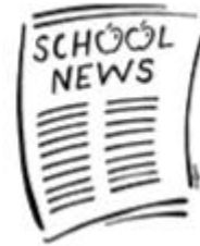
libertad de expresión

“Derechos fundamentales no pueden ser quitados.”