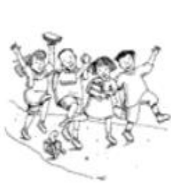
reunirse en grupo

Principio 11. Hay algunos derechos fundamentales garantizados a todas las personas. El voto de la mayoría nunca podrá quitar estos derechos de la gente, incluso si la mayoría es muy grande y la minoría es muy pequeña.